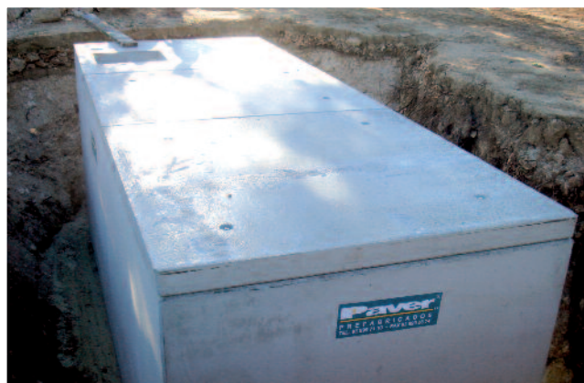
Orificios personalizados para tuberías de