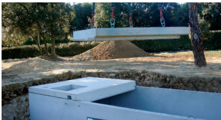
Cubierta por segmentos