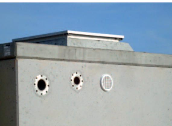
conexión entre depósitos